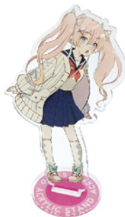
■フィギュアタイプ