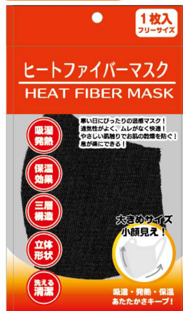
■商品パッケージイメージ